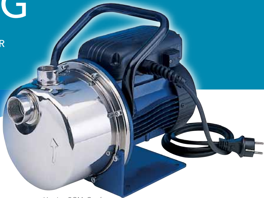
Version BGM Garden

ZUR FÖRDERUNG VON REINEN ODER LEICHT VERUNREINIGTEN MEDIEN